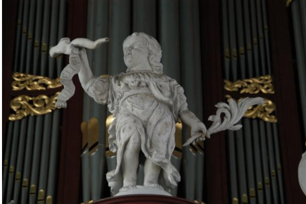
Engelfiguur met sjofar op het rugwerk.