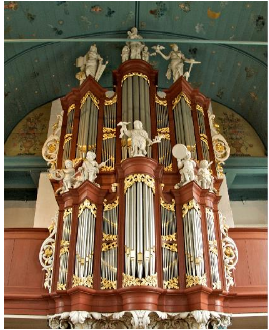
Van Dam orgel uit 1779