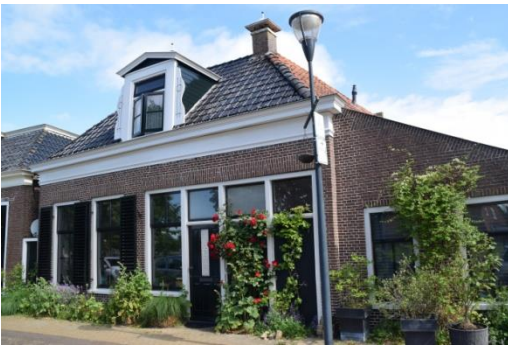
Afb 3 en 4: Weaze Eastein 3 vooraanzicht en achterkant.

Op 26 november 1857 tijdens de classisvergadering vindt de instituering van de Afgescheiden gemeente plaats. Deze wordt bevestigd in de dienst van zondag 18 december 1857. In die dienst gaat ds. R.L. van der Scheer uit Lippenhuizen voor. Deze predikant treedt ook op als consulent. Bij Koninklijk Besluit nr. 22 van 4 juni 1860 ontstaat formeel de “Christelijke Afgescheidene Gereformeerd Gemeente te Oldeboorn” Het adres van de kerk wordt in het besluit aangegeven als Oldeboorn nr.251a (nu Weaze Eastein 3). Het adres van de eerder genoemde omgebouwde schuur.